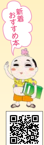
日南市立図書館のホームページ