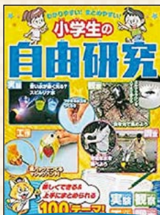
わかりやすい! まとめやすい! 小学生の自由研究