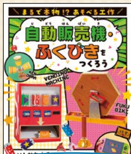
自動販売機・ふくびきをつくらう