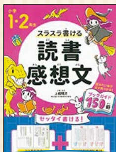
スラスラ書ける読書感想文